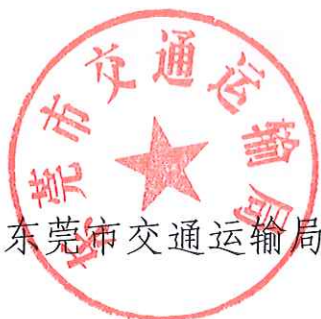
东莞市交通运输局