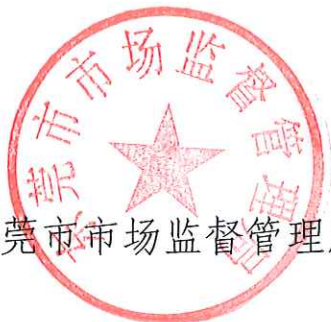
东莞市市场监督管理局