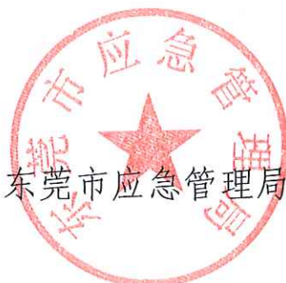
东莞市应急管理局