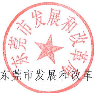
东莞市发展和改革委员会