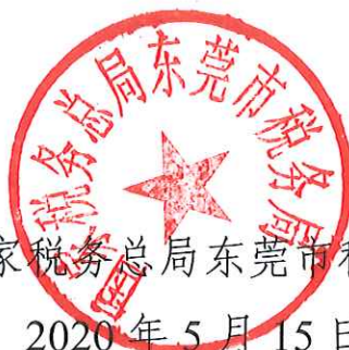
国家税务总局东莞市税务局