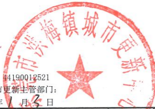
洪梅镇统领城市更新单元“三旧”改造房屋权籍调查明细表

标图建库号: 44190012521 镇(街)城市更新主管部门: 时间: 2024年1月5日