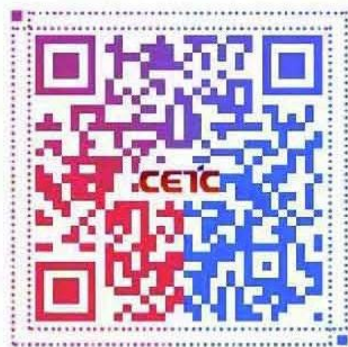
密切接触者测量仪